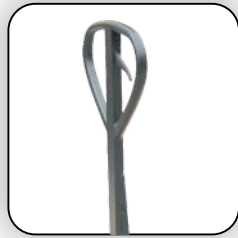
دستگیره با روکش کاملا لاستیکی