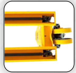
محور قابل تنظیم