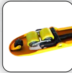
روارهای ورودی جهت عملکرد آسان طراحی نوین مجموعه چرخهای جلو