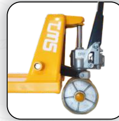
ظرفیت پمپ قابل تنظیم